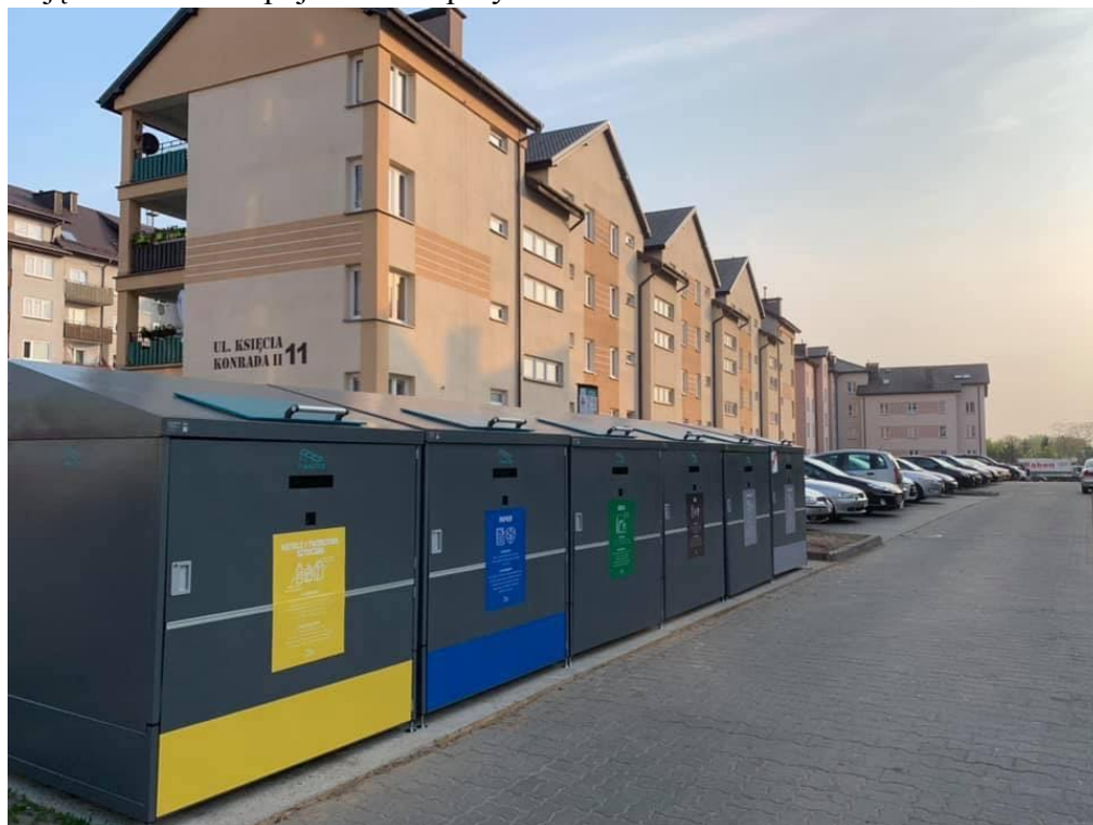
Zdjęcie 1. Zestaw pojemników przy ul. Andersa

Otwieranie pojemników możliwe jest jedynie po zeskanowaniu kodu kreskowego, który mieszkańiec przykleja do worka z wcześniej posegregowanymi odpadami lub do pojedynczego odpadu. Po wrzuceniu worka i zamknięciu pojemnika, odpady są ważone, a dane o ich masie, przesyłane i zapisywane w systemie centralnym SISO. Zainstalowane w pojemnikach czujniki monitorują w czasie rzeczywistym poziom ich wypełnienia, tym samym zapobiegając ich przepełnieniom.