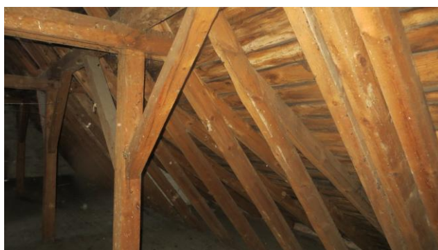
Ogólny widok więźby oraz deskowania – widoczna miejscowa korozja biologiczna deskowania.

Więźba dachowa 2-spadowa o konstrukcji drewnianej płatwiowo-kleszczowej, odeskowana, kryta blachą stalową falistą. Krokwie 14x10cm co 72cm oparte w połowie swojej długości płatwiami 15x13cm. Płatwie podparte słupami 13,5x13,5cm co 293cm