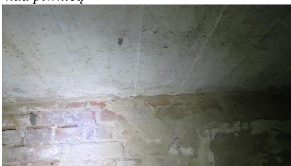
Widok stropu nad piwnicą.

Jest to płyta żelbetowa monolityczna wieloprzęsłowa o układzie konstrukcyjnym podłużnym oparta na ścianach zewnętrznych podłużnych i wewnętrznych murowanych z cegły ceramicznej pełnej gr.27cm. Nie stwierdza się rys ani nadmiernych ugięć. Jest wystarczający do przeniesienia obciążeń z