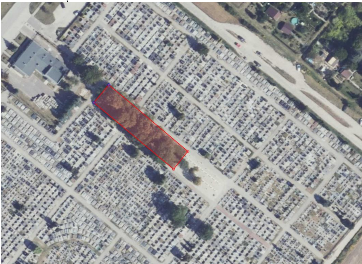
Rys. nr 1. Teren objęty inwestycją

Zadanie należy realizować na części działki nr ew. 1136 oznaczonej na Rys. nr 1 kolorem czerwonym. Część działki nr ew. 1136 objęta zamówieniem zwana jest w dalszej części Nieruchomością.