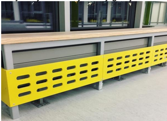
Przykład osłony kanałów z ławką na balkonie