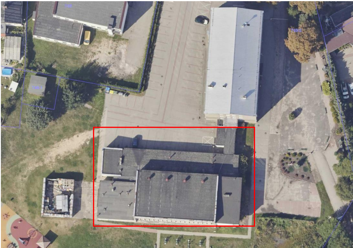
Rys. 1. Salę sportową wraz z zapleczem i łącznikiem, objęte zamówieniem oznaczono ramką w kolorze czerwonym.

W zakres robót wchodzi wykonanie wszelkich prac i robót budowlanych w zakresie funkcjonowania obiektu zgodnie z przeznaczeniem, przy spełnieniu minimalnych wymogów określonych w niniejszym PFU.