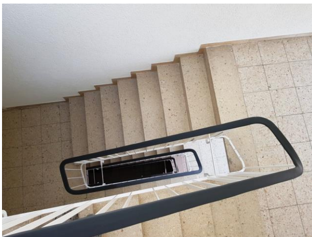
Wzór balustrady z poręczą w listwie PCV