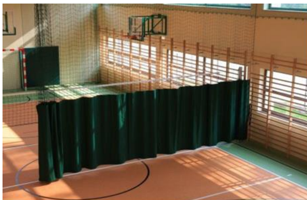
Wzór kotar grodzących do dostarczenia w ramach zamówienia