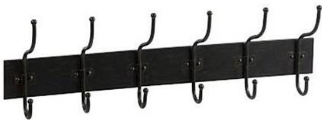
Wzór wieszaka ściennego szatniowego (36 m)