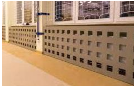
Przykłady ażurowej osłony grzejników do wykonania w ramach zamówienia