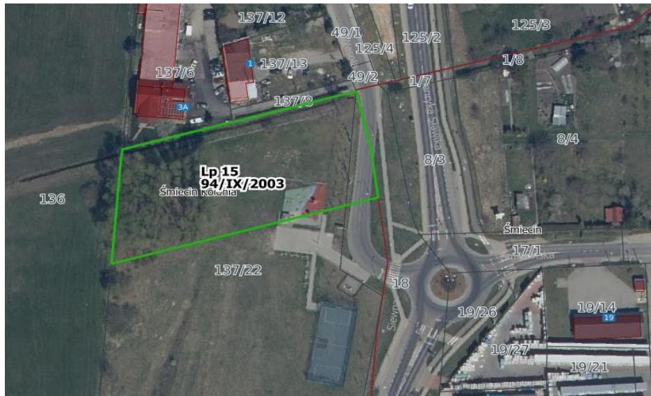
Rys. nr 1. Teren objęty inwestycją.