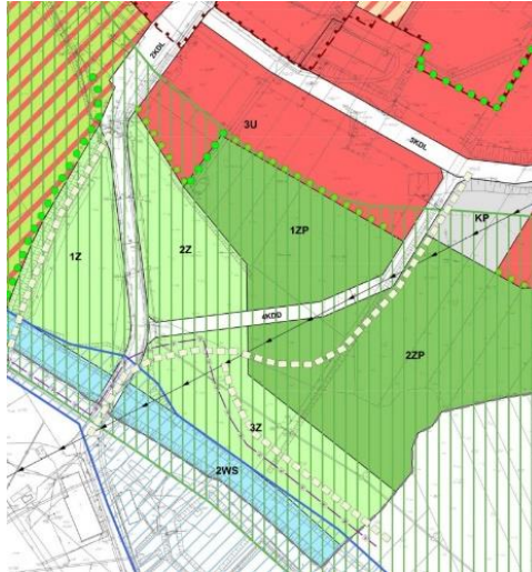
Rys. Miejscowy Plan Zagospodarowania Przestrzennego "Orylska" w Ciechanowie.