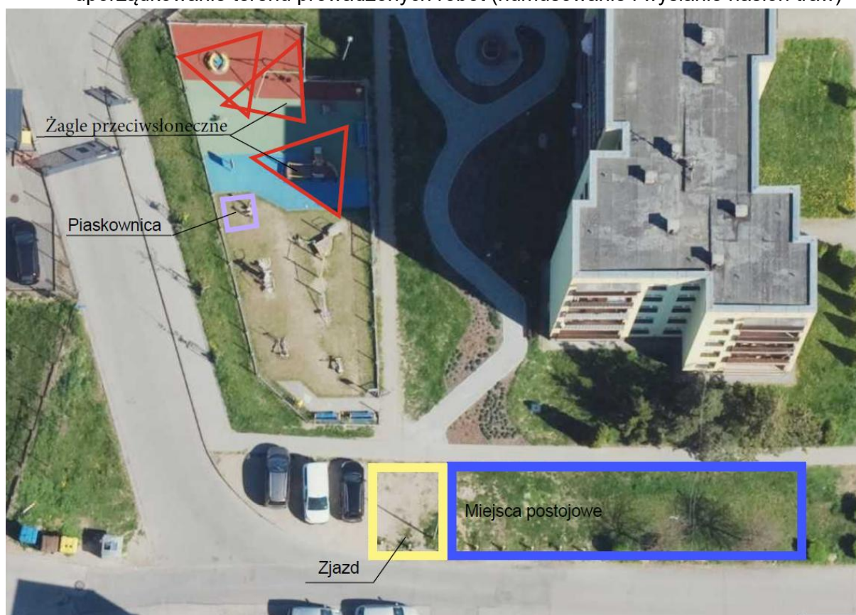
Rys. nr 2. Planowana lokalizacja miejsc postojowych, zjazdu, żagli przeciwsłonecznych i piaskownicy.