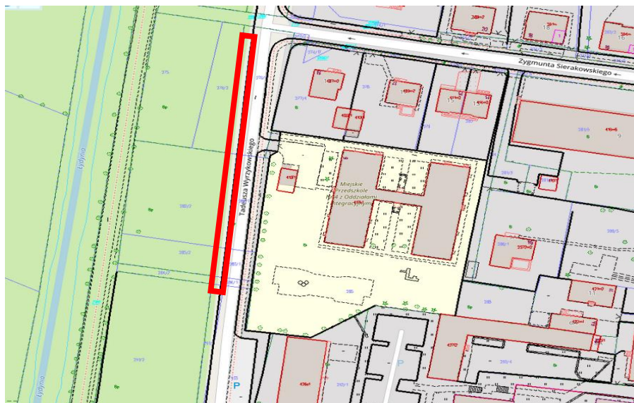
Rys. nr 1. Obszar zagospodarowania terenu zaznaczono na rys. kolorem czerwonym.