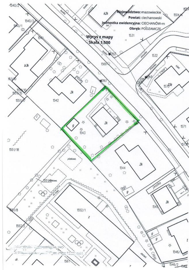
Rys. nr 1. Obszar objęty inwestycją.