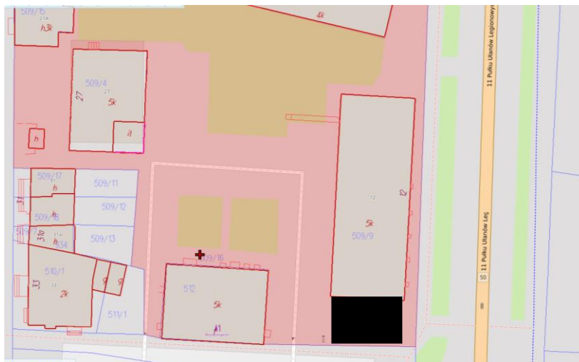
Rys. nr 1. Teren objęty zamówieniem w zakresie projektu zaznaczono na rys. kolorem czarnym