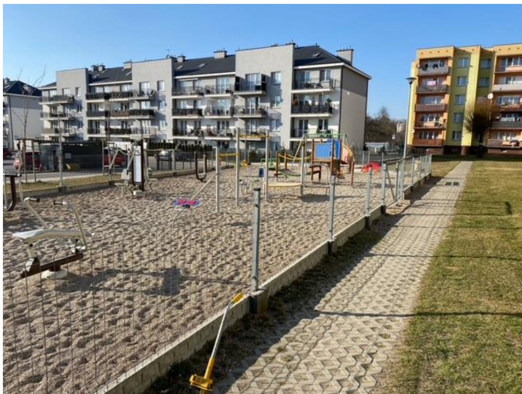
Nawierzchnia bezpieczna na placu zabaw i siłowni przy ul. Powstańców Wielkopolskich